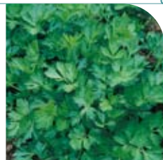
Céleri à Couper