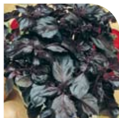
Basilic Purple Opal