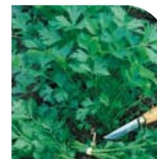
Persil Géant d'Italie