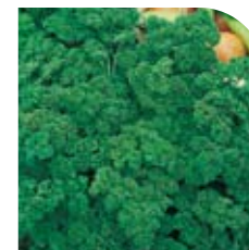
Persil Frisé Vert Foncé