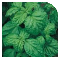
Basilic à Feuille de Laitue