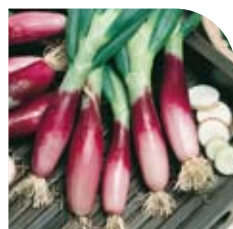
Ciboule Commune Rouge