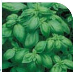
Basilic Grand Vert