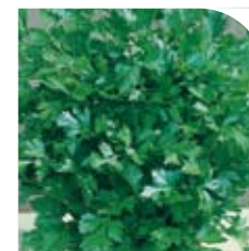
Persil Commun 2