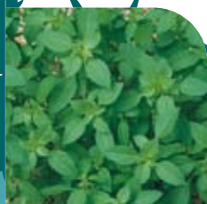
Basilic Fin Vert